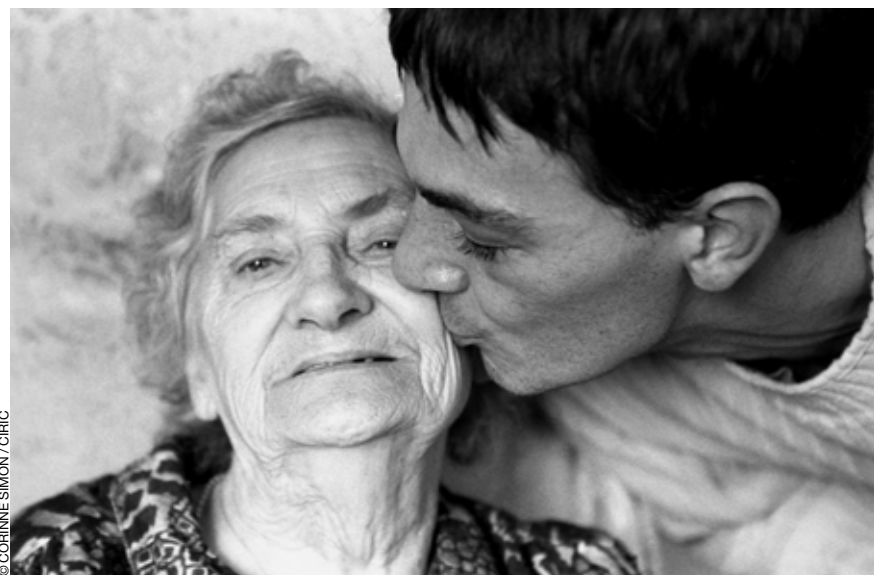
L'accompagnement: une présence joyeuse et affectueuse.

70 % des malades vivent chez eux. Il n'existerait d'ailleurs pas suffisamment de structures adaptées pour les