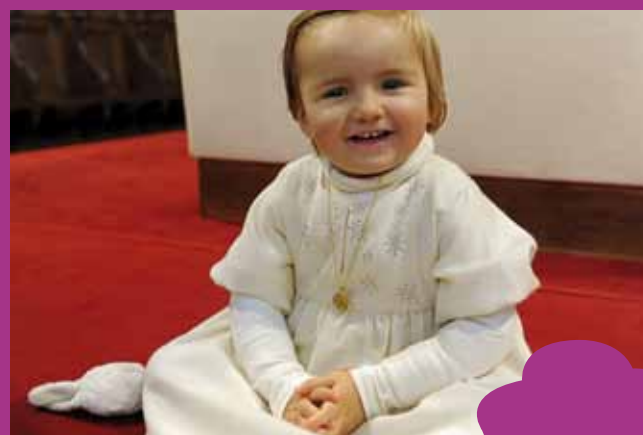
Tu es devenue enfant de Dieu, Alléluia!