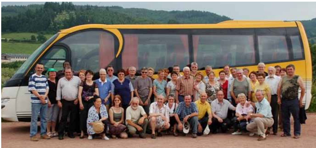
Un voyage, une rencontre, un partage.