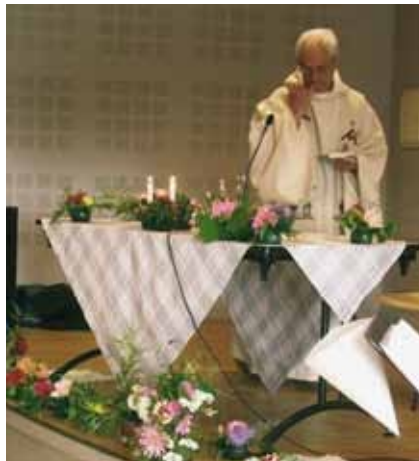
Notre « Table du jour »