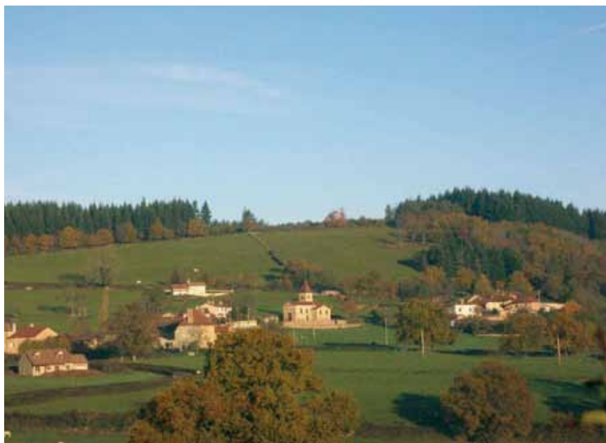
Montagny-sur-Grosne, le plus petit village du canton de Matour

thème de cette fête ? On célèbre surtout les activités et métiers d'autrefois : la fabrique du pain, bien sûr, le travail au lavoir, à la baratte, le tricot, la dentelle, et même la fabrique de cordes... Et puis, comme en tout village gaulois, la fête se termine par un grand repas et de la danse.