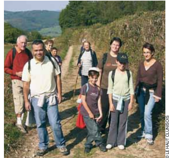
Bonne nouvelle, nos chemins se sont croisés

La célébration eucharistique peut commencer. A travers l'évangile, les chants, les textes choisis, « Dieu parle à notre espérance ». Il nous est demandé de dépasser nos fragilités, notre peur de l'inconnu (« mais qui peut dire où vont nos vies ») pour prendre le risque d'avancer au large en « espérant contre toute espérance ». Jésus nous engage sur un chemin de liberté pour vivre notre foi jusqu'au bout dans une vie toute entière engagée.