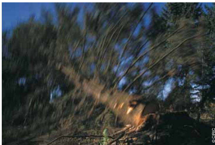
L'impressionnant moment de l'abattage.

J'ai baigné dans le bûcheronnage depuis tout jeune puisque mon grand-père et mon grand-oncle était dans le métier. Après avoir effectué un BEPA et un Bac pro au lycée forestier de Velet, j'ai ensuite travaillé pendant 3 ans ½ en tant qu'ouvrier bûcheron à Pontarlier (Haut-Doubs). J'ai ensuite eu envie de m'installer à mon compte pour être plus autonome. J'ai donc créé une EURL en mai 2009.