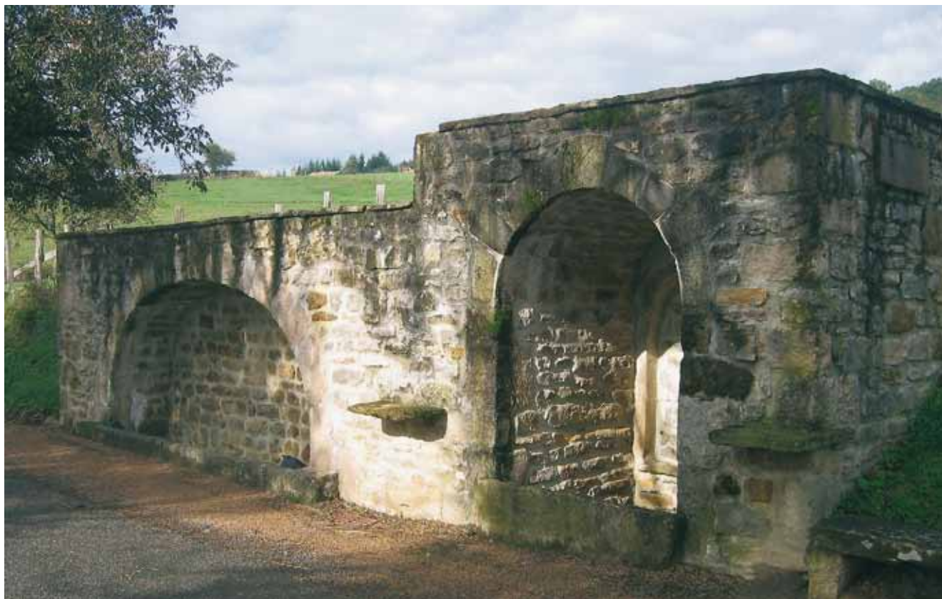
La fontaine restaurée.

Propos recueillis par Jeanne Besson et Antoine Buffet