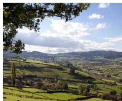
Douceur du paysage.

Les anciens « pure souche » se jugeraient-ils trop sévèrement ? Les gens d'ici seraient, d'après certains, distants, réservés, voire fermés, repliés sur eux-mêmes (mais « gagnant à être connus » tout de même !). C'était peut-être vrai il y a quelques décennies. Ce