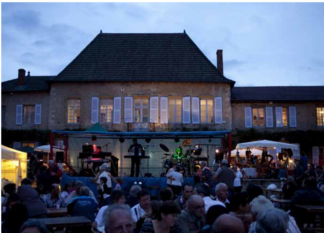
« C'est vivant, ça bouge, c'est plein d'animations. »