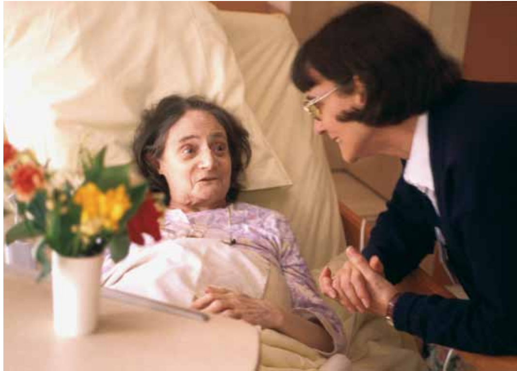
Pouvoir partager des instants précieux, même en fin de vie.

Il s'agit essentiellement de soulager, par tous les moyens, la souffrance physique et psychologique. De plus, ce temps qui reste, qui est un temps de vraie vie, il est très précieux. Il peut être vécu intensément, permettre de faire le point, de continuer encore dans le sens d'une évolution personnelle. Parole d'un malade en phase terminale : « J'apprends ce qu'est la vie, de jour en jour. » Cela n'est pas possible si la personne est très souffrante ou se sent abandonnée. Elle doit être entendue et comprise quand elle dit désirer mourir. Mais l'expérience prouve que les demandes d'euthanasie correspondent souvent à un appel