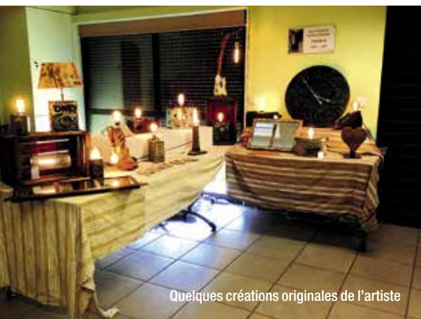
Quelques créations originales de l'artiste